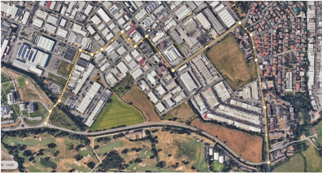
Figura n. 3 – Percorso alternativo dalla via Fizzonasco alla via Rita Levi Montalcini – Direzione da Estverso Ovest