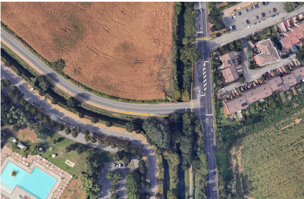
Figura n. 6 – Percorso pedonale attivo durante la fase 2 di risanamento del CavoVisconti