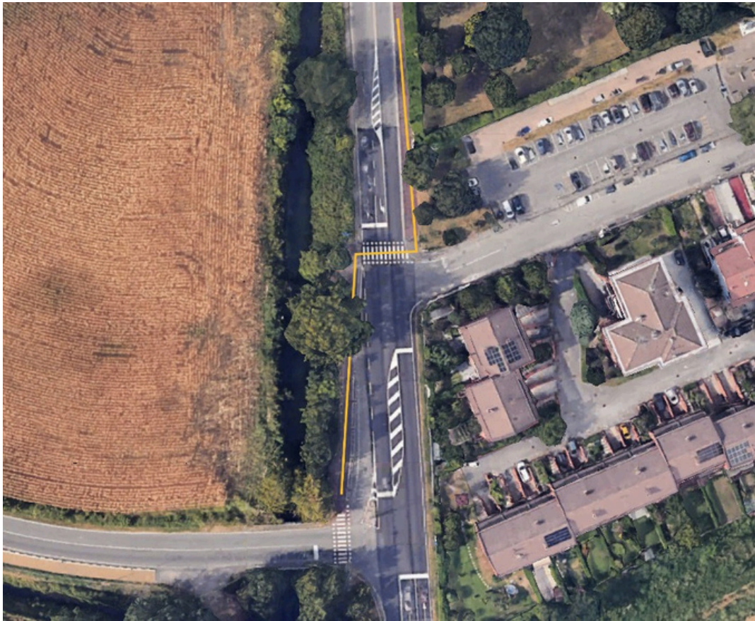
Figura n. 7 – Percorso pedonale attivo durante la fase 3 di risanamento del Cavo Visconti