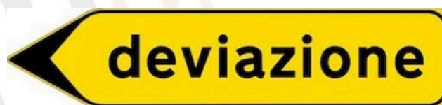
Figura n. 1 – Postazione 01 di indicazione STRADA INTERROTTA A 950 METRI e DEVIAZIONE PER VIA FIZZONASCO