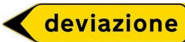
Figura n. 2 – Postazione 02 di indicazione STRADA INTERROTTA e DEVIAZIONE PER VIA RITA LEVI MONTALCINI

In corrispondenza degli incroci disposti lungo i tracciati del percorso alternativo tra le vie Rita Levi Montalcini e Fizzano è prevista la posa del cartello DEVIAZIONE.