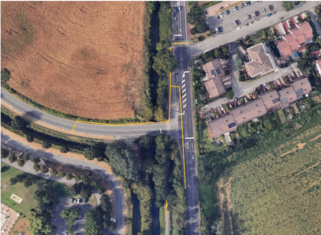
Figura n. 5 – Percorso pedonale attivo durante la fase 1 di risanamento del CavoVisconti