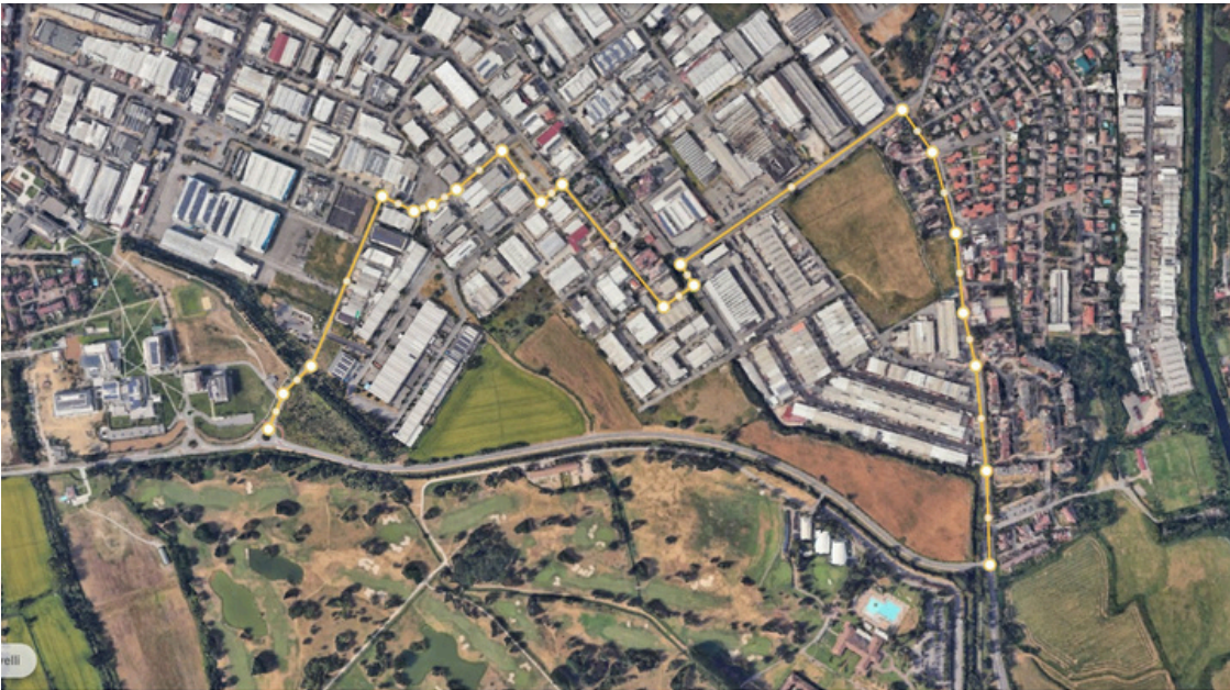
Figura n. 4 – Percorso alternativo dalla via Rita Levi Montalcini alla via Fizzonasco– Direzione da Ovestverso Est